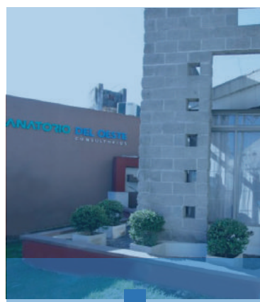
ANEXO STA. ROSA