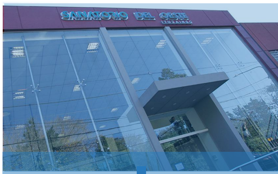
SANATORIO DEL OESTE ITUZAINGÓ