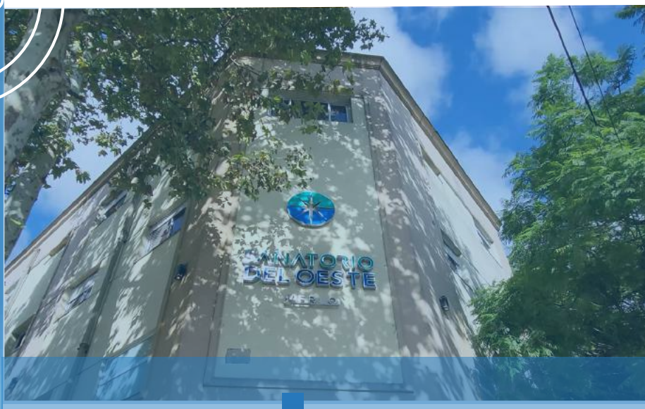
SANATORIO DEL OESTE MERLO